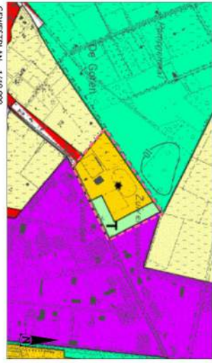
GEWESTPLAN - 1/10.000

Projectnr: ANTWERPEN Gemeente: HILSTHOUT RUIMTELIJK UITVOERINGSPLAN RUP Sportpark Joris Verhaegen