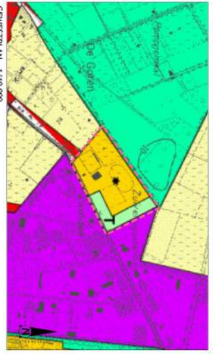
GEWESTPLAN · 1/10 000

Projectie: ANTWERPEN Gemeente: HILSTHOUT RUIMLIJK UITVOERINGSPLAN RUP Sportpark Joris Verhaegen PLANBATEN Ongemak: 20 oktober 2009 Aanpakking: Opgemaakt door: buba advies ruimtelijke kwaliteit St. Walderrudiststraat 9b 2200 Herentals Tel.: +32 (0)14 22 28 28 Fax: +32 (0)14 22 28 28 Steenbouwkundige E. Belens Architectenbureau L. Inchausti Ref.: 08021410_02 Architect: ARC Architectenbureau Oude Markt 20 3000 Leuven Tel.: +32 (0)31 23 12 34 Fax: +32 (0)31 23 12 34 www.arc.be Architect: ARC Architectenbureau Oude Markt 20 3000 Leuven Tel.: +32 (0)31 23 12 34 Fax: +32 (0)31 23 12 34 www.arc.be