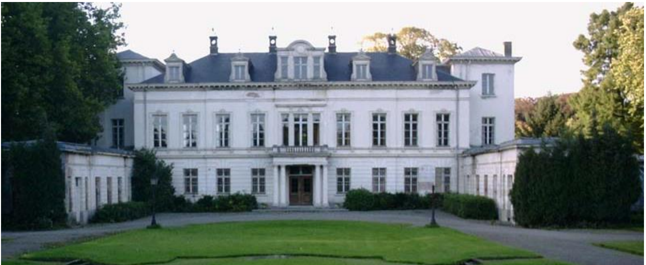
Hof ter Borgh