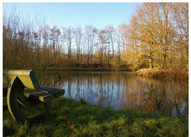
Natuurgebied langs de Nete