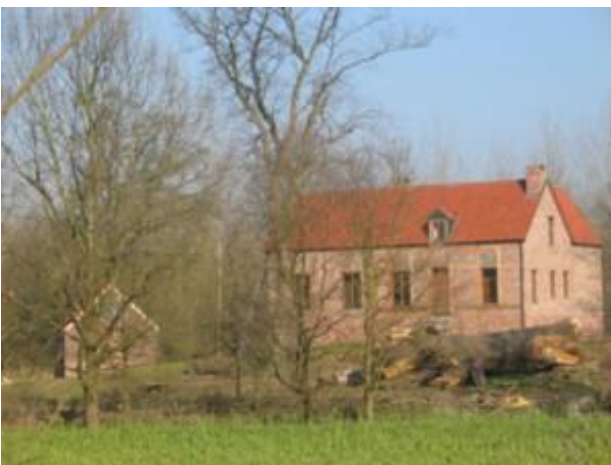
Hoeve 't Bergske