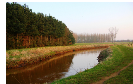
De Nete ter hoogte van de Herebossen